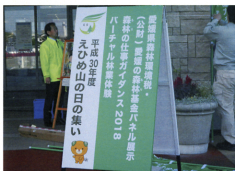
相談コーナーPR立看板