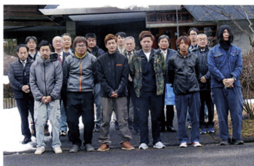
愛媛県林業技能技士