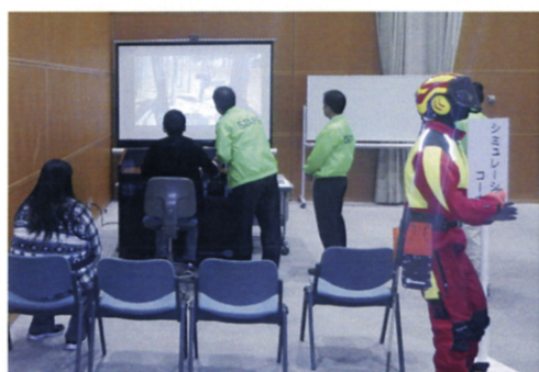
シミュレーション操作