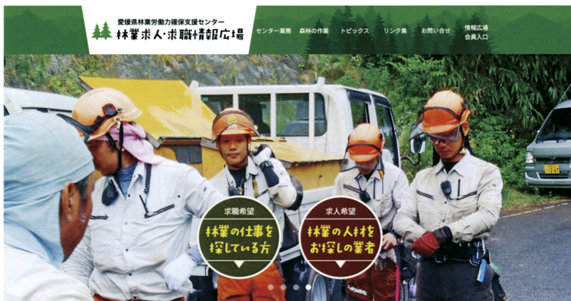
ホームページトップ画面

URL： https://www.ehime-forest-roukaku.jp/