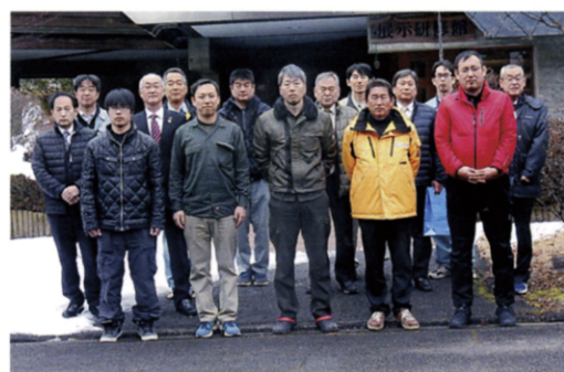
愛媛県高度林業機械技士