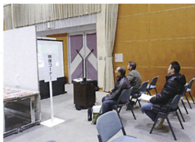
映像視聴コーナー