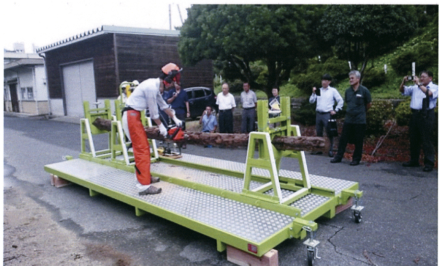
かかり木処理の練習装置