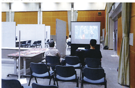
映像視聴コーナー