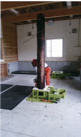
伐倒作業の反復練習装置

初心者のみならず、林業のベテランの方々も一度自らの技術を見つめ直す機会として研修してみたいかでしょうか。