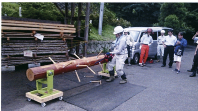
枝払いの練習装置