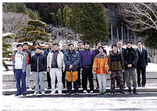
愛媛県高度林業機械技士