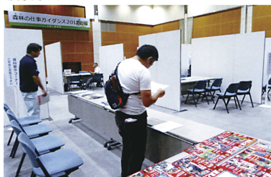
資料展示コーナー