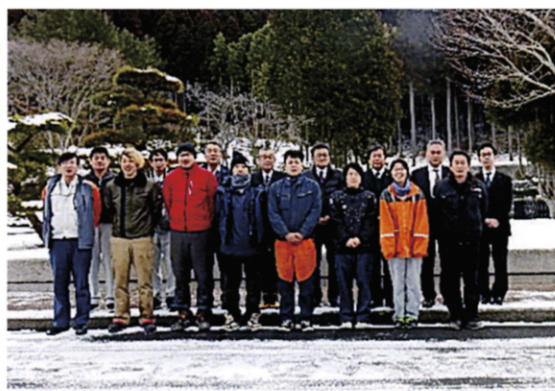
愛媛県林業技能技士