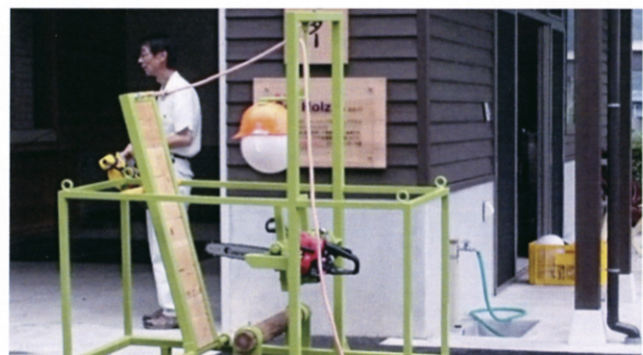
キックバック発生装置

注意！ 写真はイメージとして「とっとり林業技術訓練センター（愛称Gut Holz）」を撮影したもので、愛媛県内の施設ではありません。