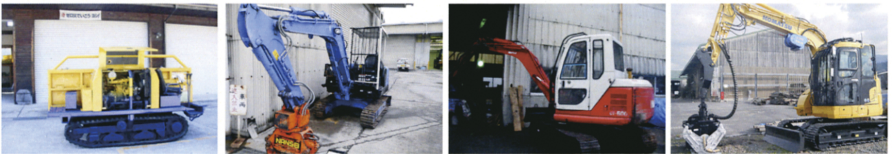
【林業機械貸付要件等】

林業事業体の雇用管理の改善及び事業の合理化に取り組む認定林業事業体に、機構保有のプロセッサ、グラップル付きバックホー、木材運搬車を貸し出します。